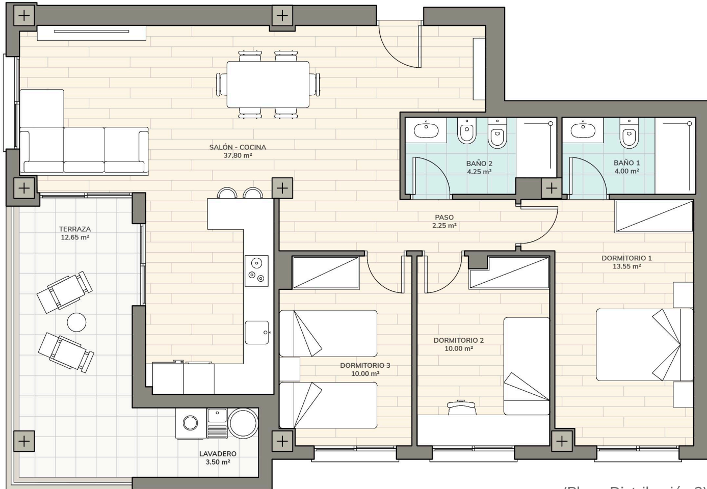
(Plano Distribución 2)